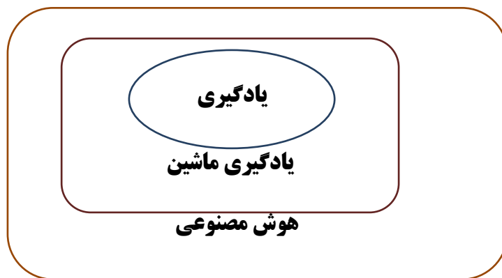
شکل ۳ تصویر رابطه بین هوش مصنوعی، یادگیری ماشین و یادگیری عمیق

- آموزش فرآیند یادگیری از نمونه داده‌ها بدون نظارت بر آن است و به‌طور مداوم از داده‌های ورودی یاد می‌گیرد.