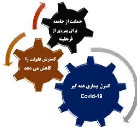
شکل ۴ تصویر کنترل غیرمستقیم بیماری COVID-19 با حمایت از جامعه برای پیروی از قرنطینه

می کند تا قرنطینه شوند؛ روابط اجتماعی از راه دور به طور مؤثر به منظور کاهش شیوع عفونت و به نوبه ی خود در کنترل بیماری کمک می کند که در شکل ۴ نشان داده شده است. در تجزیه و تحلیل چنین فناوری هایی، به سه حوزه که به موجب آن افراد بتوانند در پی فاصله گذاری اجتماعی با زندگی روزمره خود کنار بیایند می توان اشاره کرد؛ این حوزه ها عبارتند از: دور کاری، آموزش از راه دور و نظارت؛ که در زیربخش های زیر مورد بحث قرار خواهند گرفت.